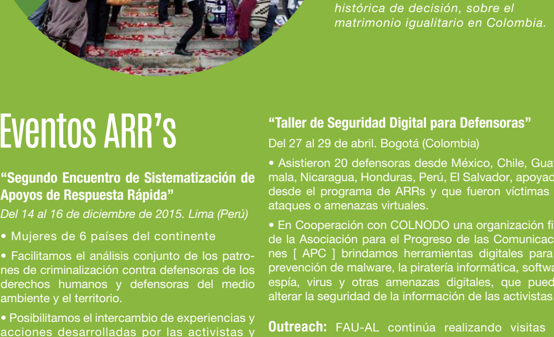
Foto: de la Campaña "Derecho a Decidir = Personas libres" de Chile por la aprobación de la iniciativa de ley que despenaliza el aborto en 3 causales

En 2015 respaldamos las acciones de incidencia de activistas en Chile y República Dominicana, por la despenalización del aborto.